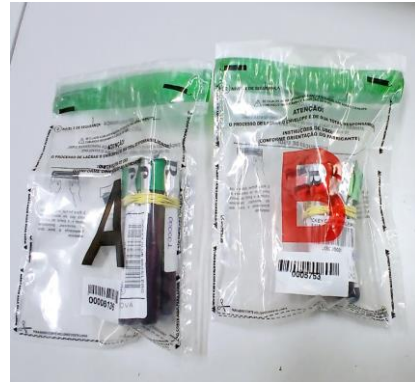
Figura 16 – malotes com tubos de sangue tampa verde