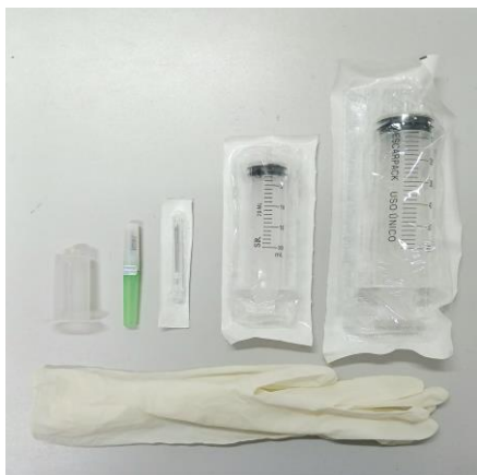
Figura 6 – seringas e agulhas descartáveis e luvas de procedimento