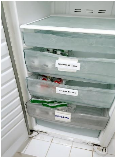
Figura 17 – freezer para armazenamento de amostras