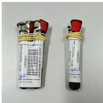
Figura 13 – tubos de sangue sem anticoagulante com gel separador