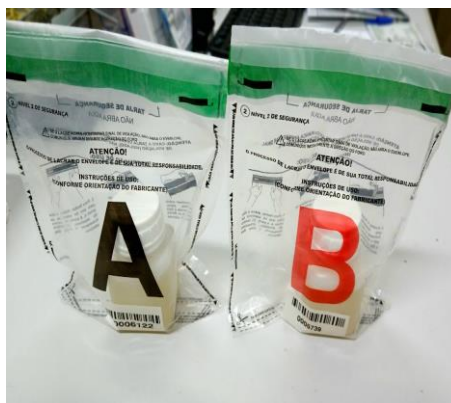
Figura 12- frascos de urina nos malotes