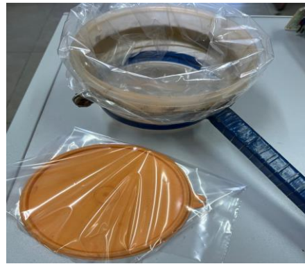
Figura 5 – suporte envolvido com saco plástico descartável