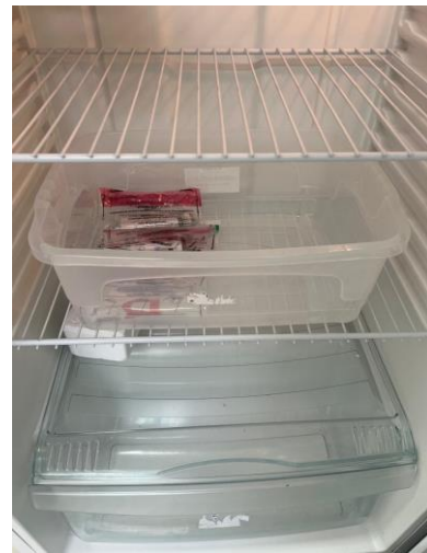
Figura 18 – geladeira para armazenamento de amostras