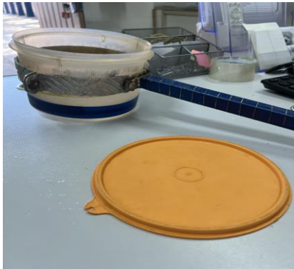
Figura 4 – suporte para coleta de urina