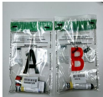
Figura 14 – malotes com tubos de sangue tampa vermelha