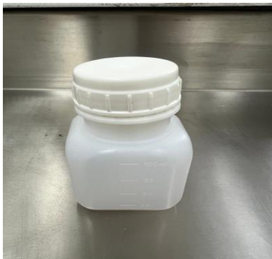
Figura 7 – frasco para coleta de urina