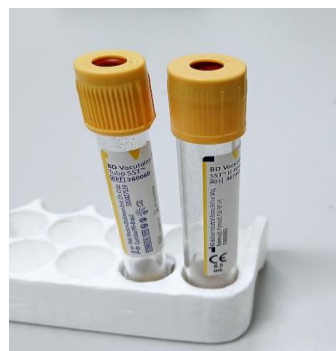
Figura 10 – tubos de tampa amarela