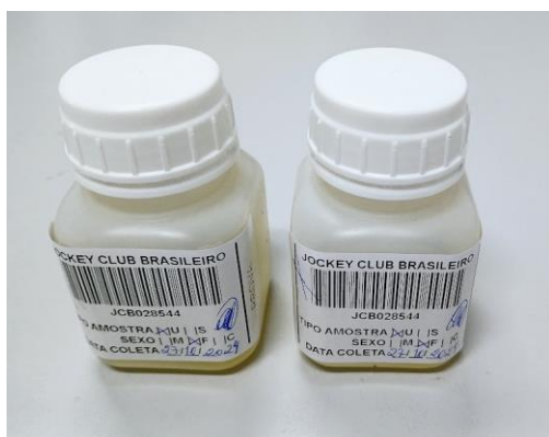
Figura 11 – frascos de urina identificados

Tanto a sala de controle quanto as duas baias de coleta possuem câmeras que transmitem imagem em tempo real para a Comissão de Corridas.