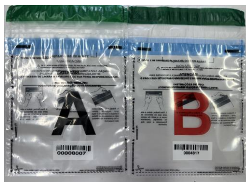
Figura 2 – malotes A e B