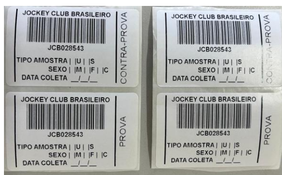
Figura 1 – etiquetas