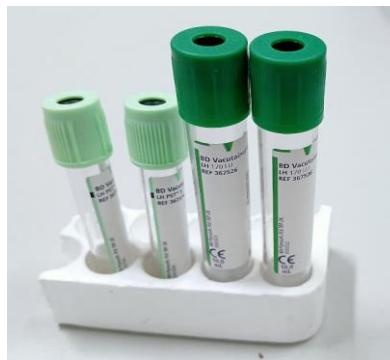
Figura 8 – tubos de heparina de lítio