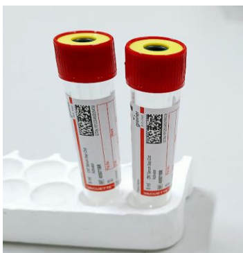
Figura 9 – tubos de tampa vermelha