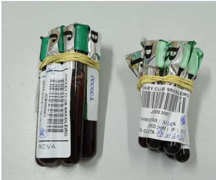
Figura 15 – tubos de sangue com heparina com e sem gel separador